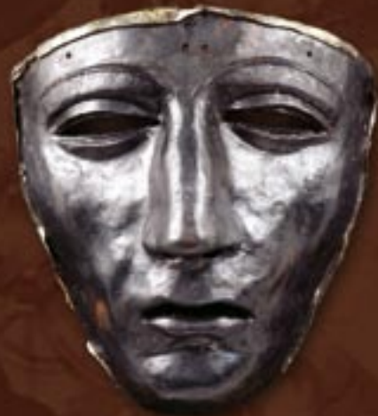
Gesichtsmaske eines römischen Reiterhelms, Kalkriese