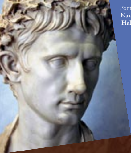
Porträt des Kaisers Augustus, Haltern am See