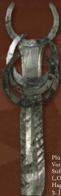
Plünderungsbeute: Votivblech mit Stifterinschrift („Obbelexxusblech“), Hagenbach, 3. Jh. n. Chr.

Kriegsbeuteopfer: Thorsberg, 3. – 4. Jh. n. Chr.